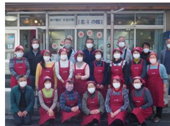
2022年度 神戸地区支え合いネットワーク協議会 神戸地区交流の館「北斗の館」運営委員会